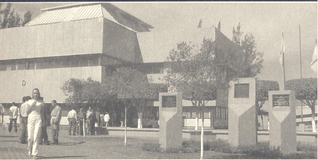
Ciudad Guzmán, Mpio. de Zapotlán, Jalisco.